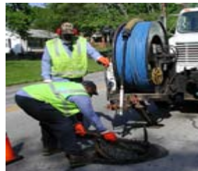
Mantenimiento de alcantarillado

Ante todo, debemos reducir la cantidad de F.O.G. (mantecas, aceites y grasa) que ingresa al sistema de alcantarillado sanitario de la ciudad de Hollister. Para hacer esto, pedimos que propietarios siga estos sencillos pasos, recicle o eliminación de las grasas, aceites y grasas: