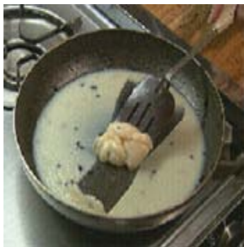
Aceites líquidos y grasas sólidas debe colocarse en absorbente contenedores antes de desconfiar.

¿Qué sucede cuando usted freír tocino, asa hamburguesas u hornea la carne? ¿Cuándo haya terminado, que es lo que queda en su cacerola de cocinar? La respuesta es la (FOG) – un verdadero enemigo de nuestro sistema de alcantarillado – una sustancia que cuando vierte por el desagüe o en su disposición de basura, se acumulan con el tiempo, restringe el flujo de las aguas residuales y provoca alcantarillas para copia de seguridad en hogares, desbordamiento de aguas residuales en los arroyos, ríos y la bahía.