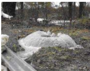
Desbordamiento de boca de alcantarilla

La ciudad de Hollister Utilidades responde rápidamente y resuelve estas copias de seguridad y se desborda. Sin embargo, la prevención es la solución mejor y más sabia a este creciente problema.